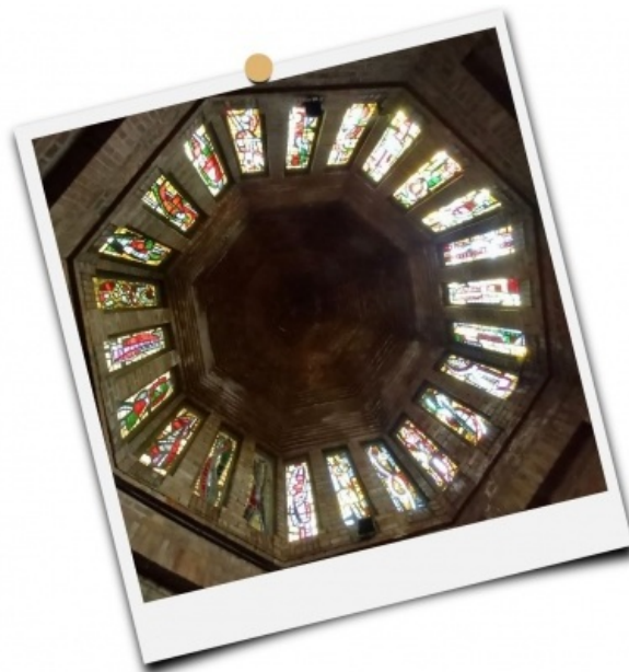
Voûte au dessus du baptistère de l'église Sainte-Jeanne-d'Arc de Gien

Que ce soit la famille ou la paroisse, la communauté chrétienne est impliquée dans la célébration du baptême, par le rituel baptismal. Par la prière, par sa présence, par tout l'environnement qu'elle pourra apporter pour soutenir la foi des futurs baptisés et des baptisés, la communauté sera ce lieu permanent où le baptisé trouvera secours et consolation. En même temps, les grâces reçues par le ou la baptisé(e), sont également reçues par toute l'Eglise.