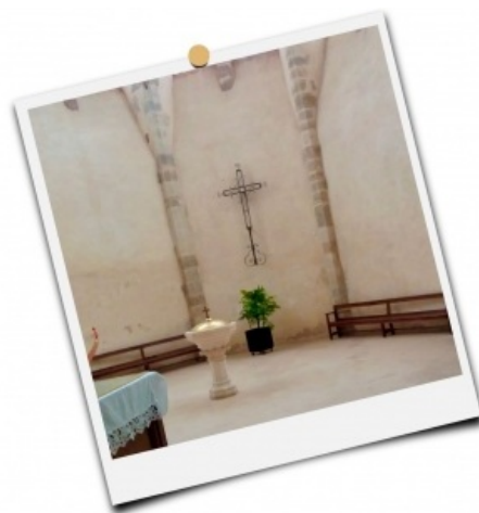
Baptistère de l'église Saint-Pierre à Chilleurs-aux-Bois

En traçant le signe de la croix sur nous, nous nous rappelons notre propre baptême et notre adhésion au projet de Dieu en toute liberté.