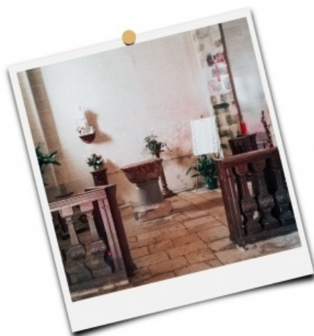
Baptistère de Notre-Dame à Lorris

Recevoir le baptême signifie être en mesure d'écouter la Parole de Dieu. La guérison du sourd muet par Jésus montre son désir que s'établissent des relations entre les êtres et avec Dieu. Tous nos sens sont appelés à ses relations. Dans le baptême, c'est le mystère entier de la vie humaine qui est représenté.