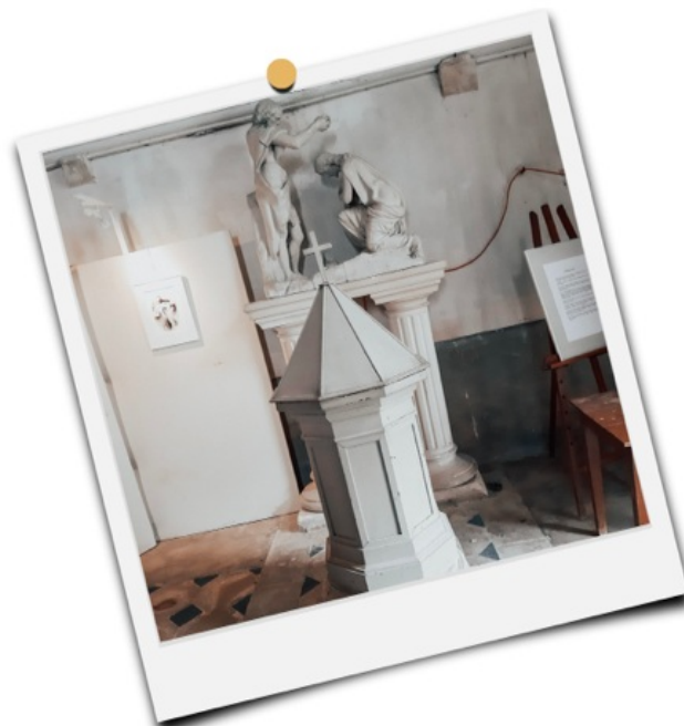
Baptistère de l'église Saint-Gault à Yèvres-le-Châtel.

L'eau est un élément vital, que ce soit pour l'homme ou pour la terre, depuis l'embryon jusqu'à l'irrigation des terres. C'est un synonyme de vie tant corporelle que spirituelle, de vie intérieure. Parfois nous nous disons desséchés quand il nous manque la connaissance ou l'amour. Quelle est la source qui peut abreuver ces manques ? Une source d'eau fraîche et savoureuse qui permet d'oser vivre, de faire ce choix, en toute pureté et authenticité ? Une source d'eau jaillissante comme notre Dieu si inépuisable en amour.